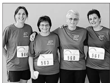
Glücklich, das Ziel erreicht zu haben, waren die Läuferinnen des BC Sulzbach.

Sulzbach-Rosenberg. Endlich war es soweit. Nach zehnwöchigem, sehr intensivem und zeit-